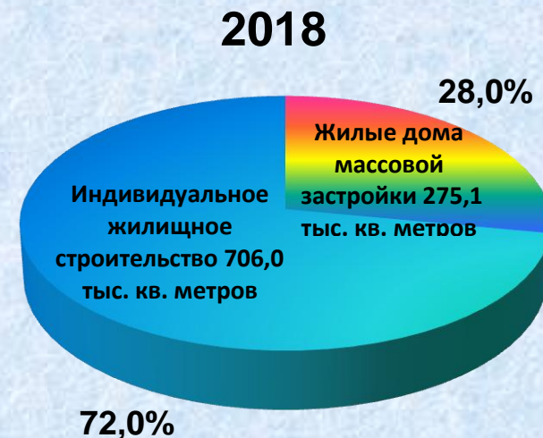
Ввод в действие общей площади жилых домов в расчете на 1000 человек населения